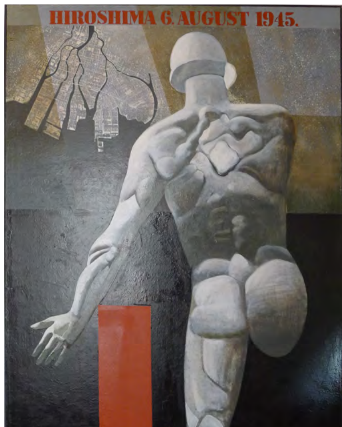
Хирошима, 97 × 130 cm