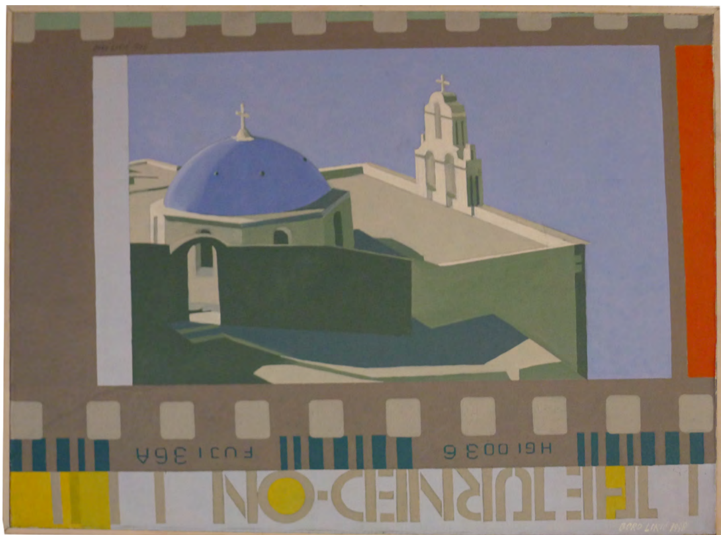
Грчки манастир, 65 × 92