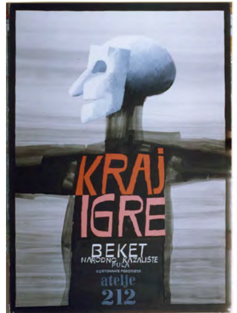
Семјуел Бекет: Крај игре, Ашеље 212, 1965.