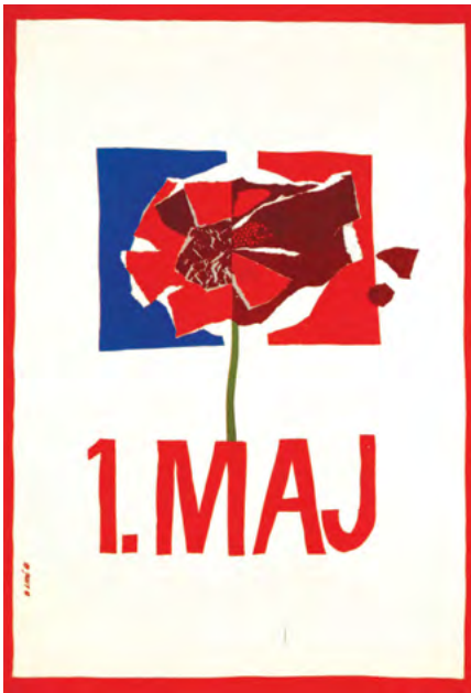
1. мај, 1966.