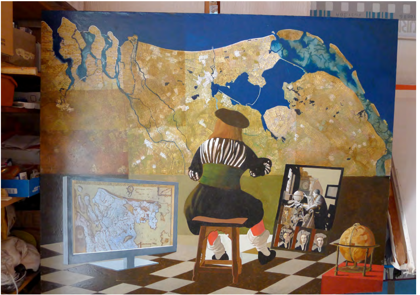
У аштелју, 130 × 160 cm