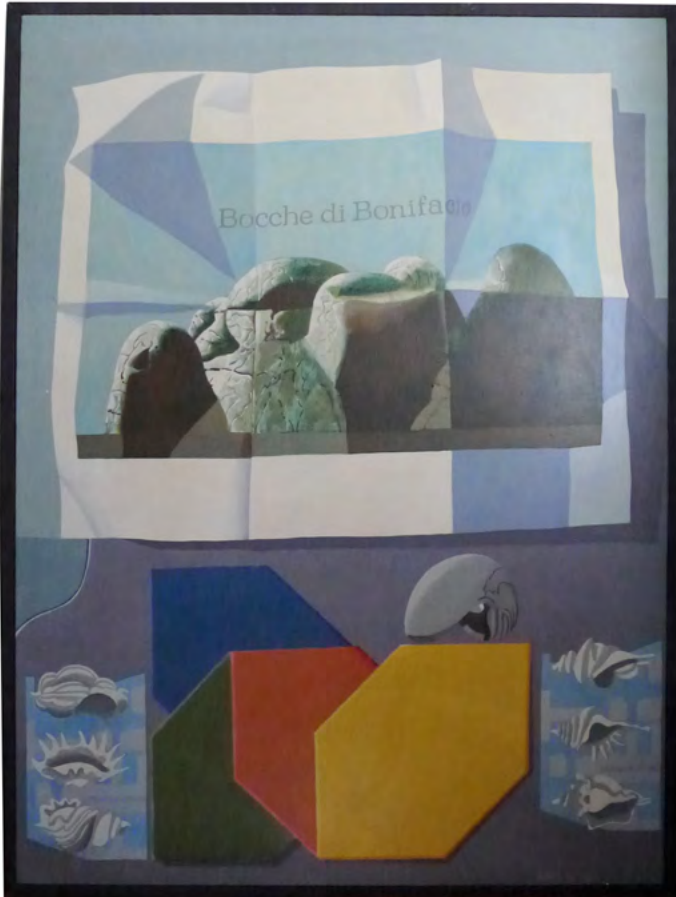
Bonifacio, 97 x 130

Боривој Ликић је примљен за асистента 17. 10. 1962. на предмет Плакаш и ѿројатандна графика . У звање доцента изабран је 1965. године. У тексту за предлог унапређења наводи се и следеће: »Употребом и коришћењем различитих средстава и начина изражавања (гигант-растер, фотографија, шприц-техника, чиста површина и фото-графика), Ликић постиже увек једноставност и упечатљивост идеје, дајући при томе приоритет ликовном изразу. Његове плакате катактеристиче рационална и функционална употреба боје, при чему су