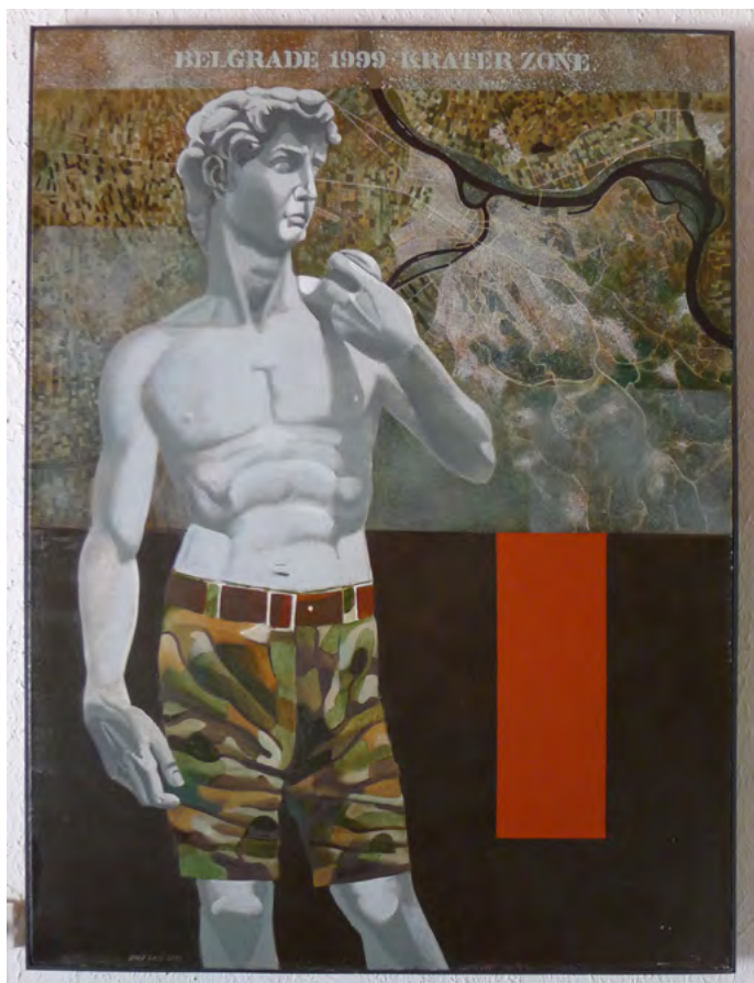
Београд, 97 × 130 cm, 1999

Изабрани цитати, настали поводом изложби Бора Лиќића, додато освећувају исцртавања и рад аутора.