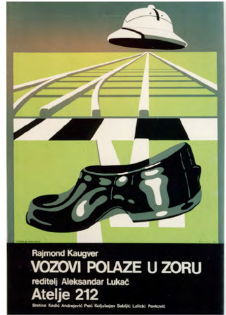
Рајмон Каугвер: Возови полазе у зору, Ашеље 212, 1986.